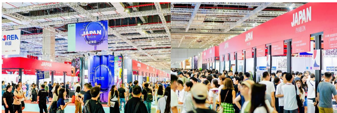
※2025 年 9 月開催 Photo