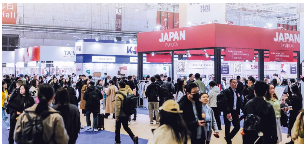
※2025 年 3 月開催 Photo