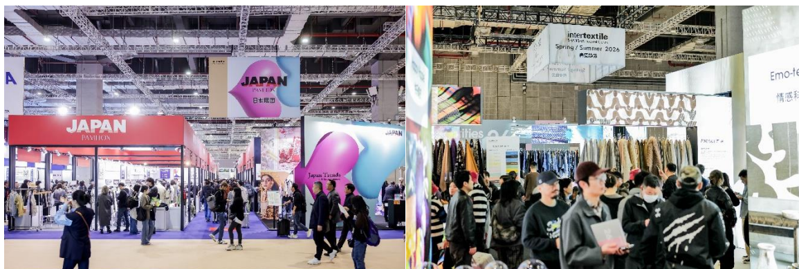
※2025 年 3 月開催 Photo

お問い合わせ先 JFW テキスタイル事業事務局 〒150-0012 東京都渋谷区広尾 1-6-10 Giraffa ビル 6 階 Tel.03-6805-0791 Fax.03-6805-0793